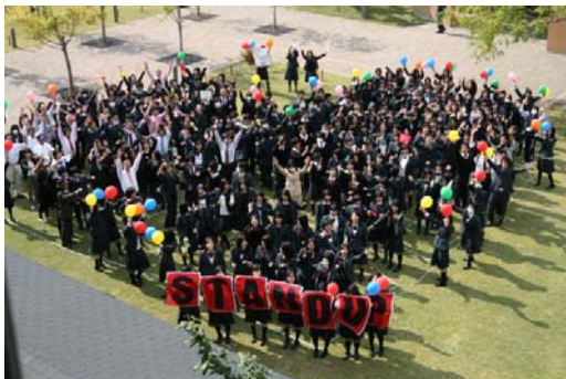
立命館守山高校(滋賀県)